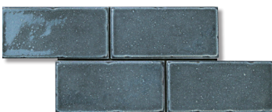
R-27 ミッドナイトブルー