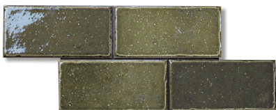
M-1 織部 2色混合